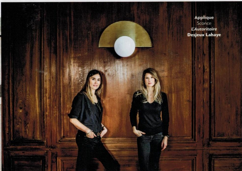
Applique Sconce L'Autoritaire Desjeux Lahaye