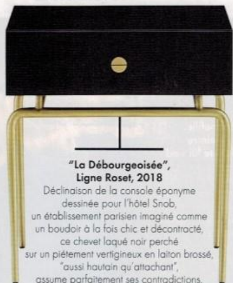
"La Débourgeoisée", Ligne Roset, 2018

Déclinaison de la console éponyme dessinée pour l'hôtel Snob, un établissement parisien imaginé comme un boudoir à la fois chic et décontracté, ce chevet laqué noir perché sur un piétement vertigineux en laiton brossé, "aussi hautain qu'attachant", assume parfaitement ses contradictions.