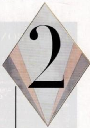
"Sommet", Versant édition, 2018

Déclinaison de la console éponyme dessinée pour l'hôtel Snob, un établissement parisien imaginé comme un boudoir à la fois chic et décontracté, ce chevet laqué noir perché sur un piétement vertigineux en laiton brossé, "aussi hautain qu'attachant", assume parfaitement ses contradictions.