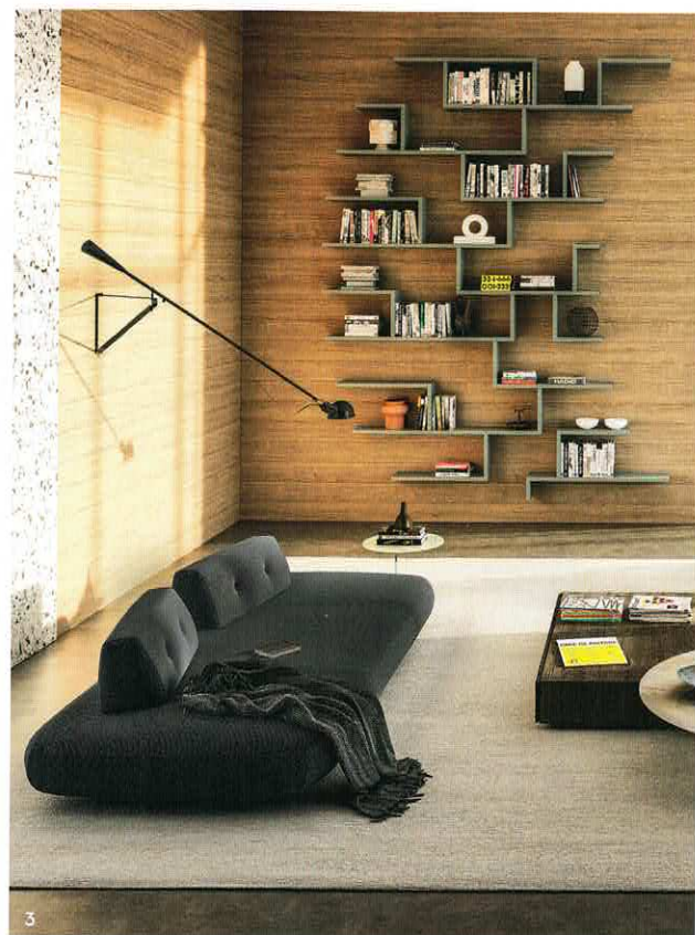
1/ Demi-canapé Jules en tissu, cuir et hêtre massif, à partir de 4 680 €. Duvivier. 2/ Canapé Rego en tissu et époxy, 110,45 €. Leolux. 3/ Canapé Sand en tissu et métal, 13188 €. Lago.