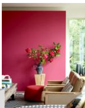
Peinture Lake Red-W92, collection Colour by Nature, Farrow & Ball x Natural History Museum de Londres.