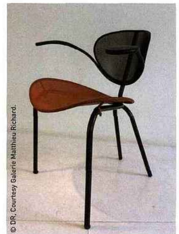
Chaise tripode de Mathieu Matégol, modèle Nagasaki, de 1954.