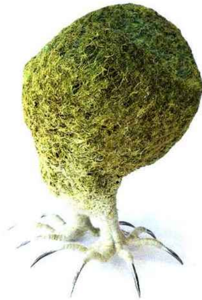
A weed