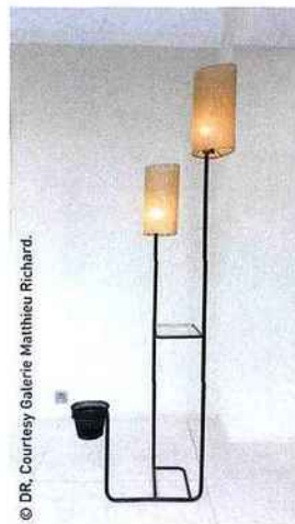
Rare luminaire de Mathieu Matégol vers 1956.

RENDEZ-VOUS À PARIS Événement majeur du marché de l'art international, le PAD revient à Paris pour y présenter ses nouvelles découvertes aux côtés des grands classiques de la peinture et du design du XXe siècle. Par ailleurs, comme chaque année depuis 2009, aura lieu la sélection pour le prix PAD mécène par Moët-Hennessy. Ce salon s'impose aujourd'hui comme un événement incontournable dans l'univers du design historique, moderne et contemporain. Paris Art & Design, du 27 au 31 mars 2013, jardin des Tuileries, Paris. www.pad-fairs.com