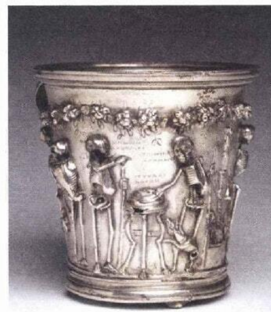
Gobelet aux squelettes, 1 er siècle de notre ère.

Les collections des salles romaines du Louvre figurent parmi les plus complètes au monde en dehors de l'Italie. Pendant leur fermeture temporaire, elles investissent Louvre-Lens du 6 avril au 25 juillet. Les plus belles et les plus grandes pièces côtoient des objets plus modestes pour rendre compte de treize siècles